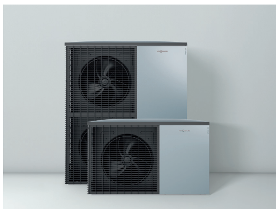
Nya uteenheterna i tidlös Viessmann-design